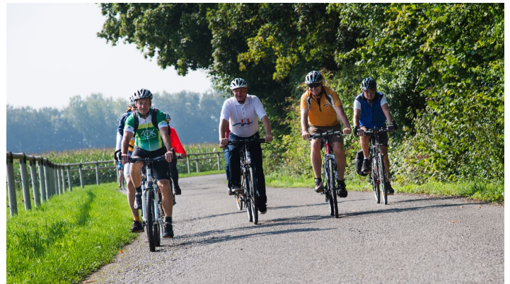
Gruppe Radfahrer