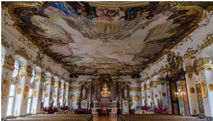
Goldener Saal Dillingen

ID: t_100077718 Zuletzt geändert am 25.02.2021, 09:42