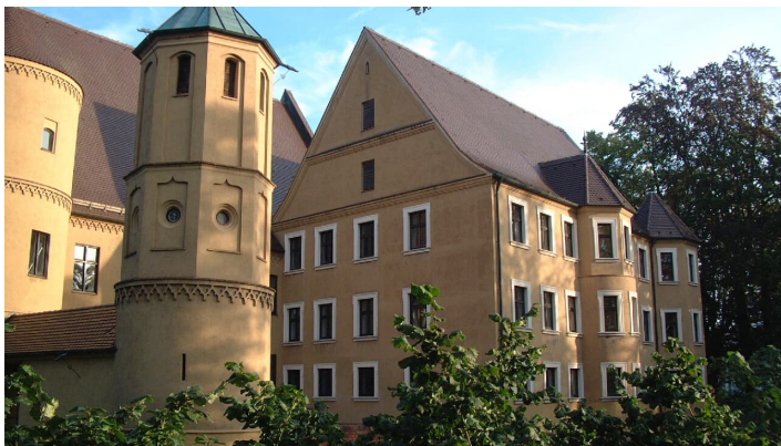
Schloss Wertingen