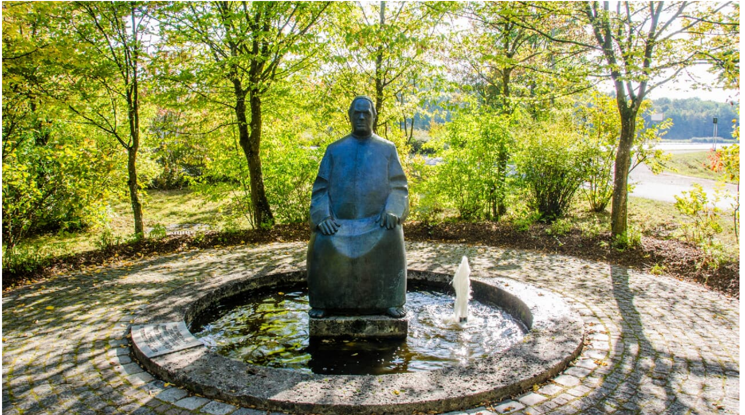
Sebastian Kneipp Denkmal