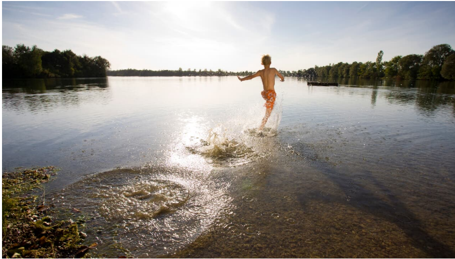
Schwäbisches Seenland