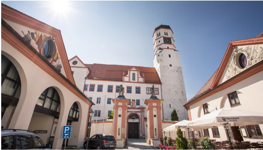
Schloss Dillingen