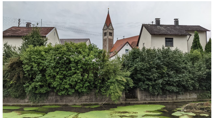
An der Egau in Schretzheim