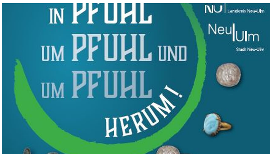
Sonderausstellung Heimatmuseum Pfuhl