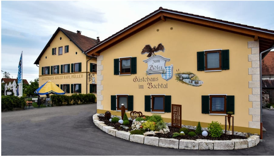
Gästehaus Adler