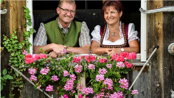
Gästehaus Adler