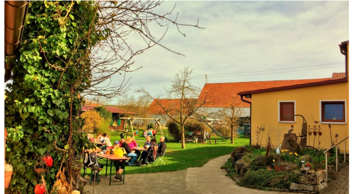
Gästehaus Adler