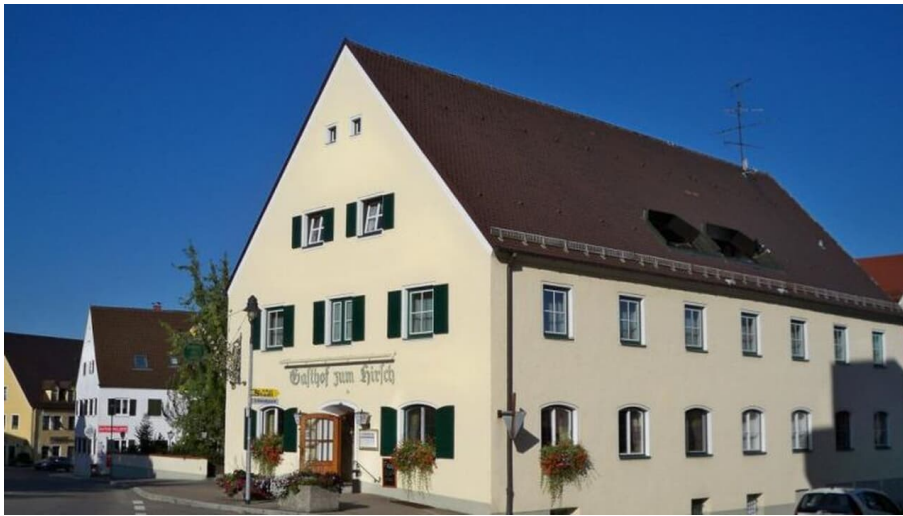
Hotel Gasthof Zum Hirsch