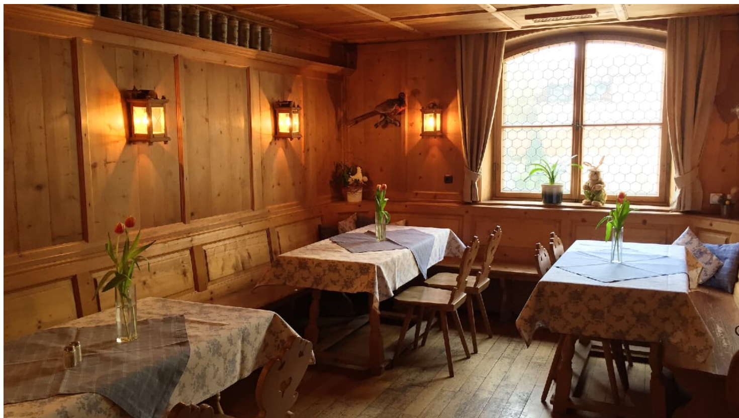
Gaststube Zum Hirsch