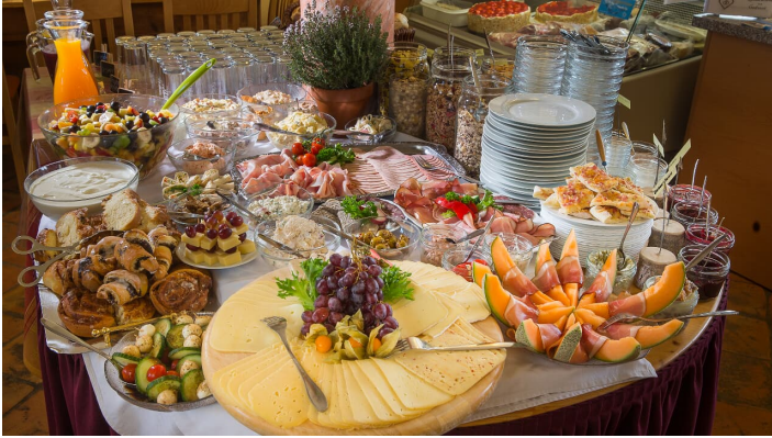
Frühsüß Hofcafé Lecheler