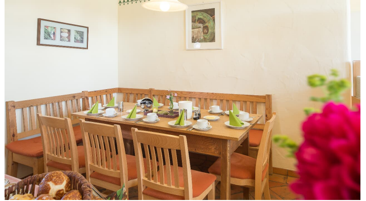
Hofcafé Ferienhof Lecheler