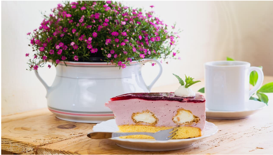
Hofcafé Lecheler