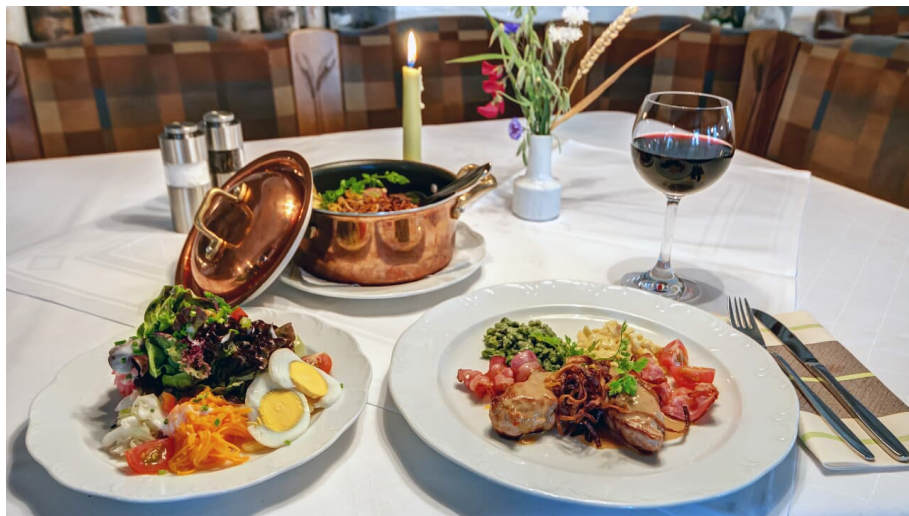
Hotel Gasthof Rössle