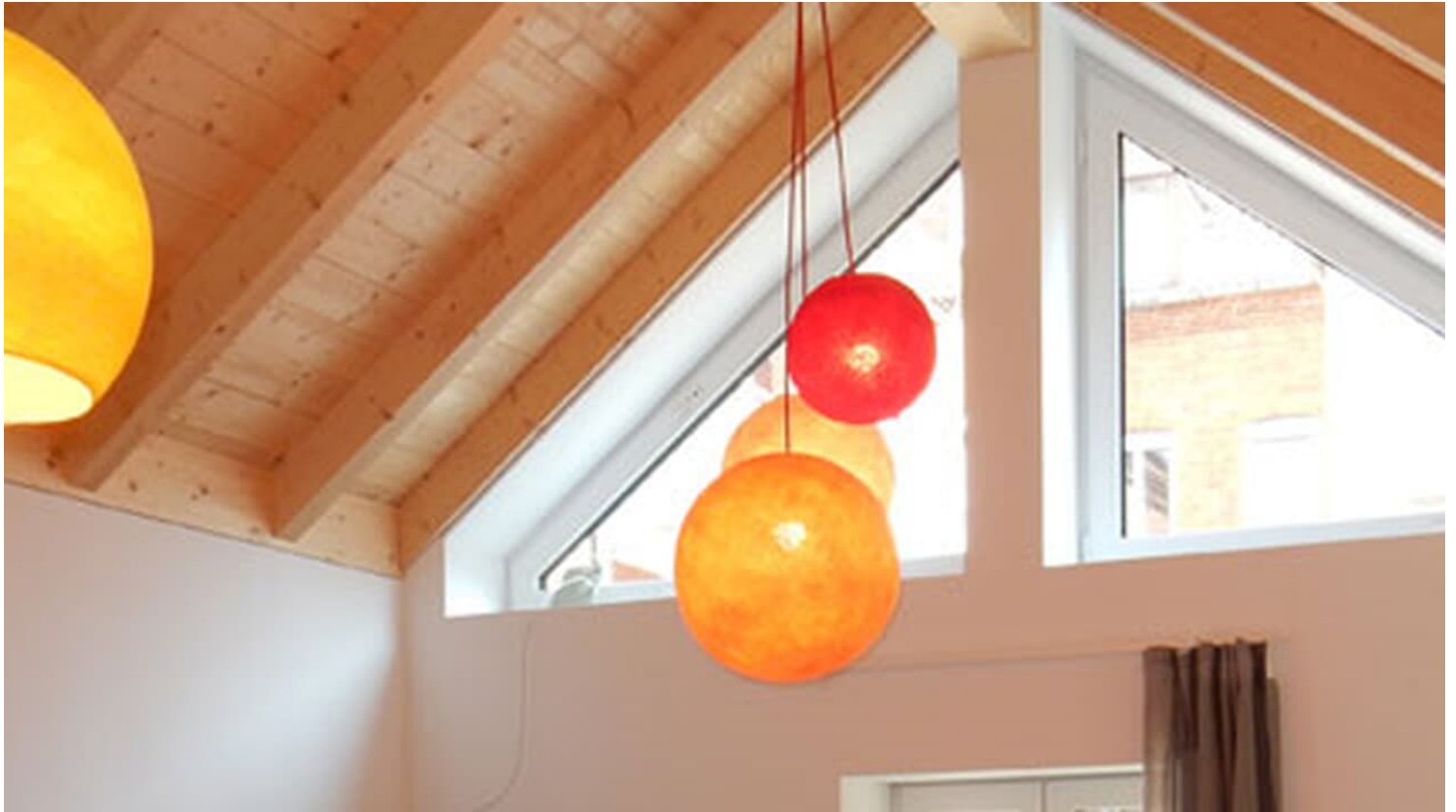
Brickstone Hostel