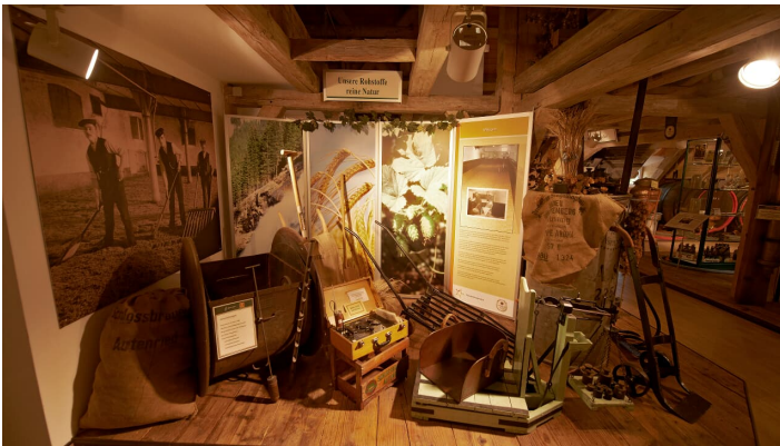
Schlossbrauerei Autenried GmbH, FRANK_RIEDERLE