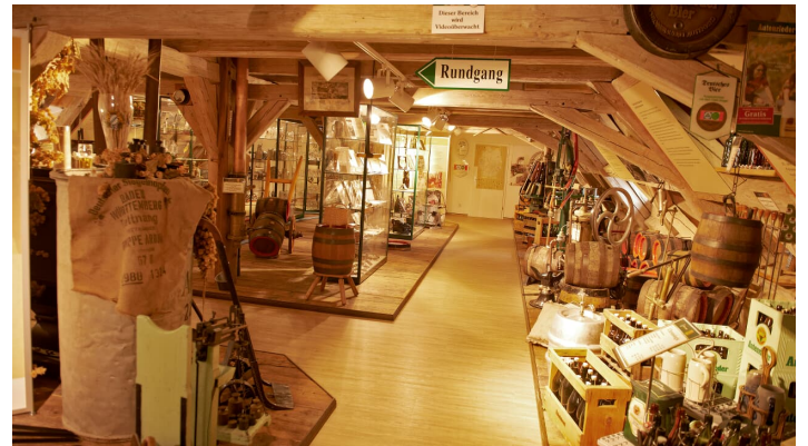
Schlossbrauerei Autenried GmbH, FRANK_RIEDERLE