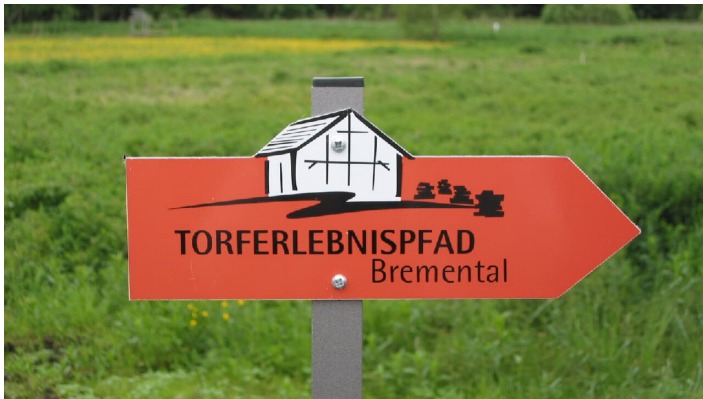
Torferlebnispfad Bremental