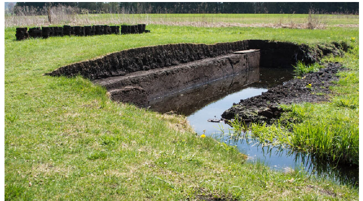
Torferlebnis Bremental