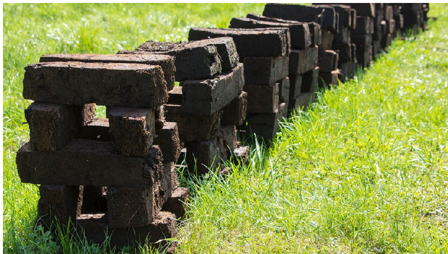
Torferlebnispfad Bremental