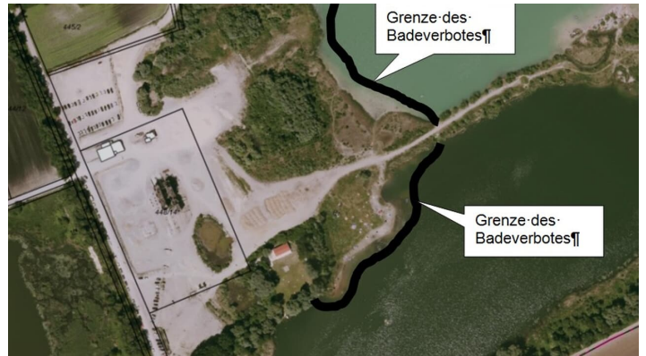
Badeverbot Vollmer See im Sand-Uferbereich