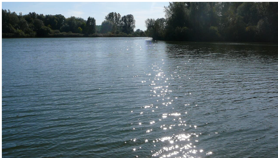
Vollmer See - © Landratsamt Günzburg