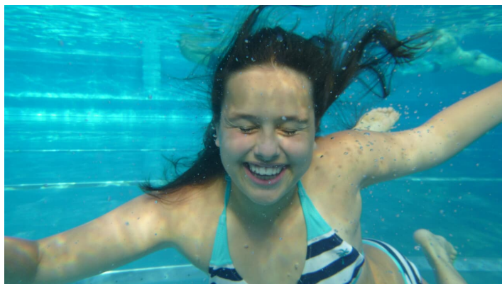
Waldbad Günzburg