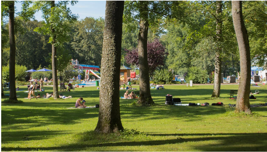
Waldbad in Günzburg - © Fouad Vollmer Werbeagentur