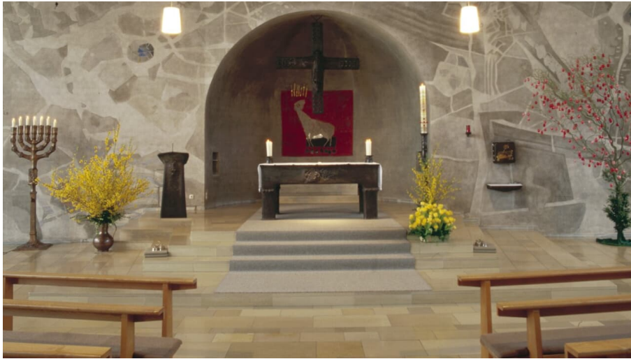
Christkönigskirche Dillingen Innenansicht - © Jan Koenen (Stadt Dillingen)