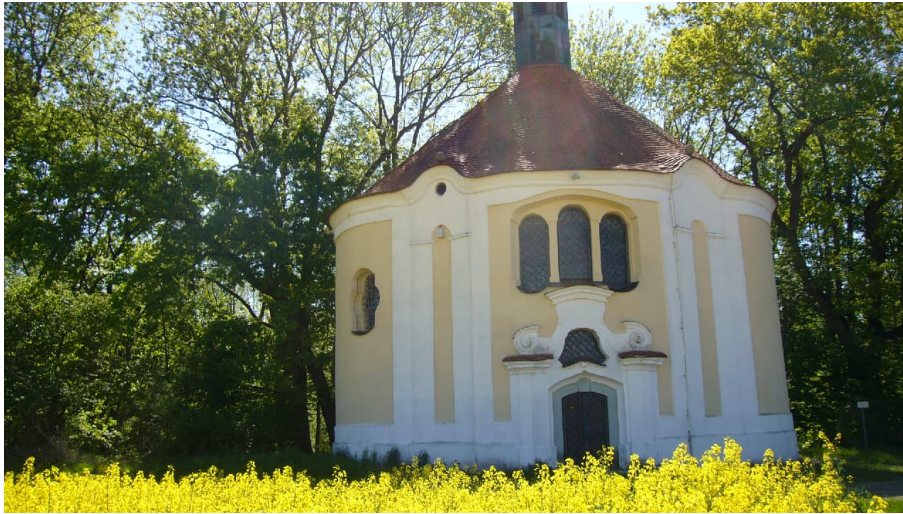
Herrgottsruhkapelle Lauingen