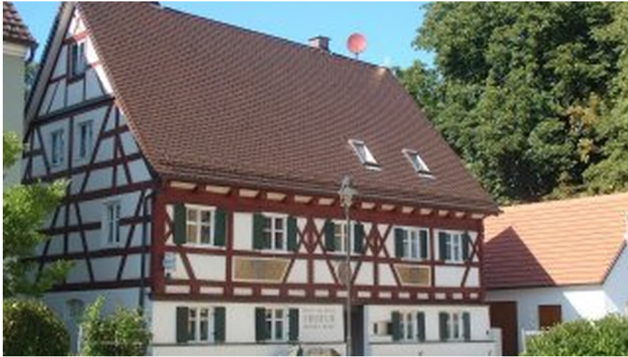
Historische Fassaden alter Fachwerkhäuser Wertingen