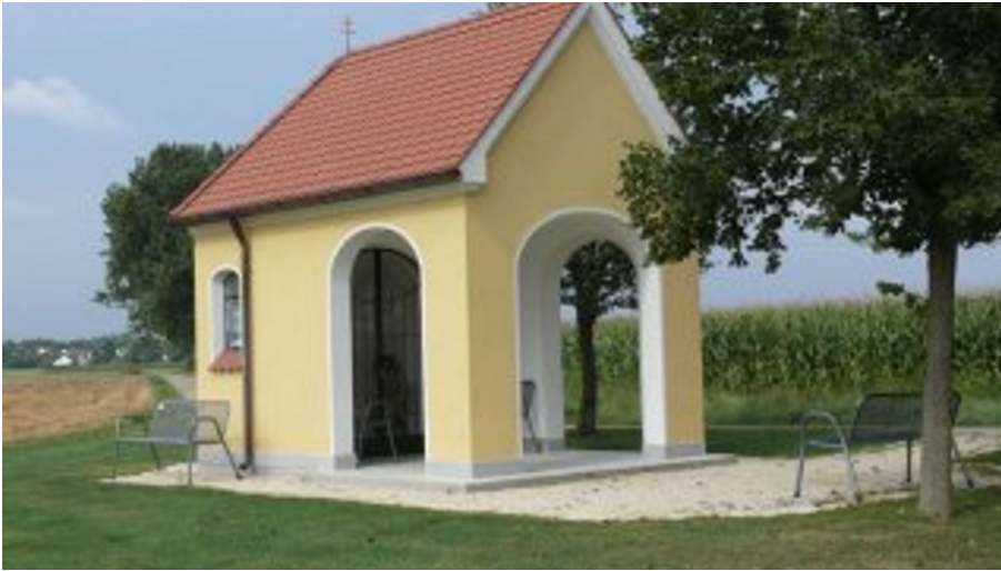
Feldkapelle St. Antonius