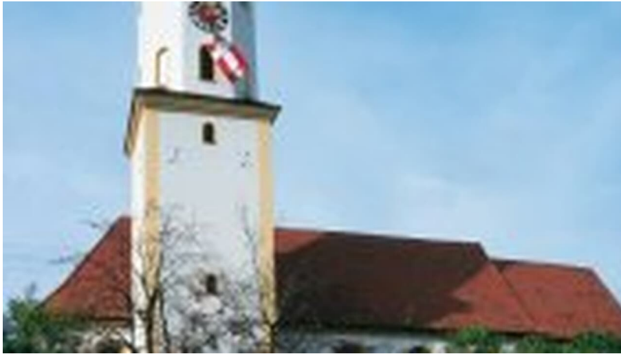
Pfarrkirche Mariä Himmelfahrt