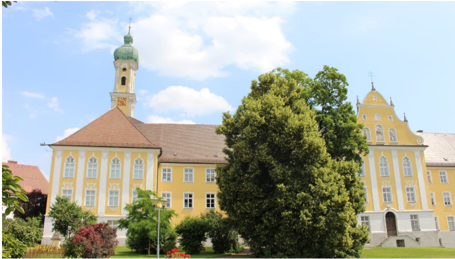
Kloster Maria Medingen