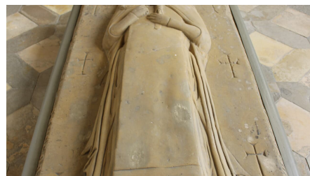
Grabmal der Mystikerin Margareta Ebner