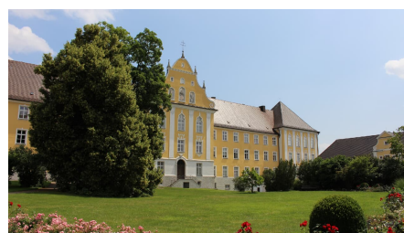
Kloster Maria Medingen