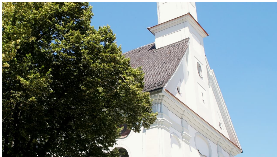
Klosterkirche Mariä Himmelfahrt