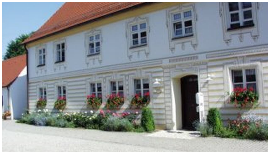
Walkmühle "Obere Bleiche"