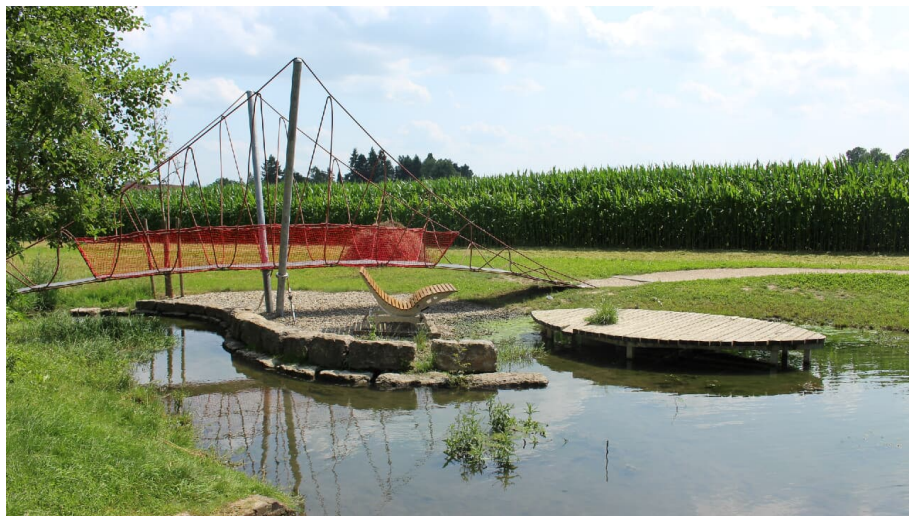
Wassererlebnis am Zwergbach