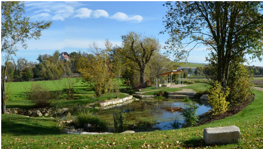
Stegbrunnen Bachhagel