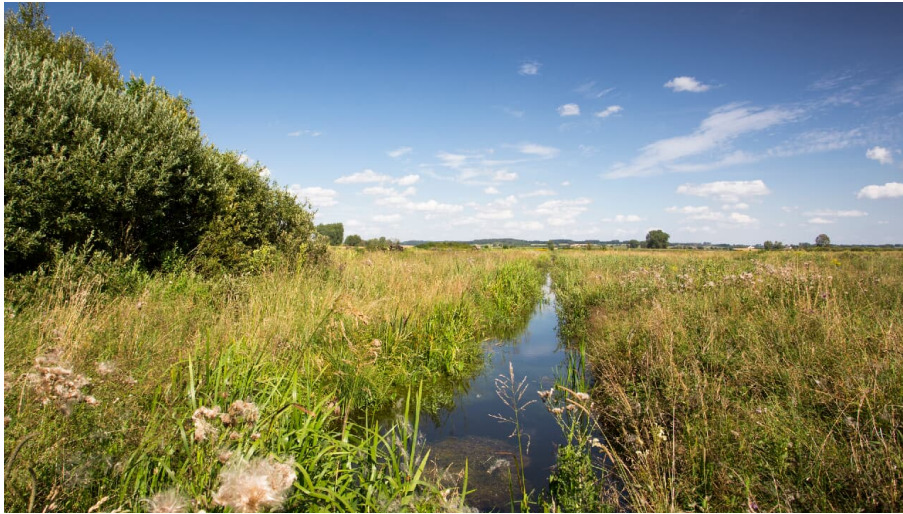
Dattenhauser Ried