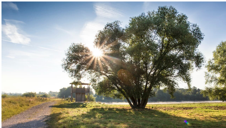
Beobachtungsturm Sophienried