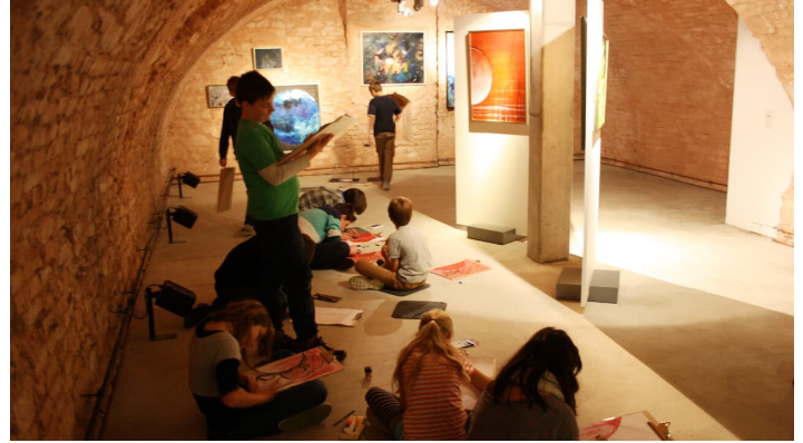
Museum für bildende Kunst im Landkreis Neu-Ulm Nersingen-Oberfahlheim