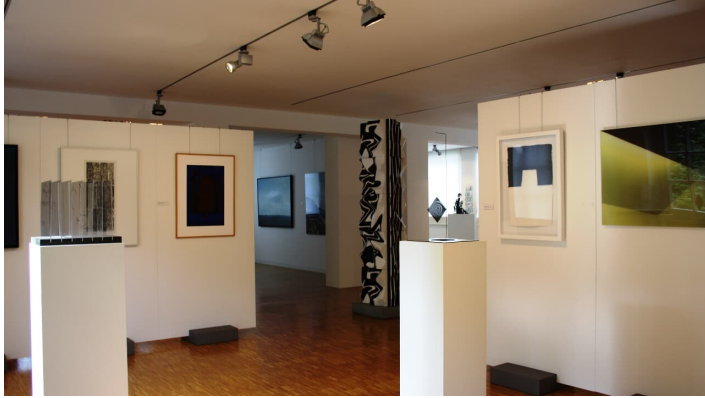
Museum für bildende Kunst im Landkreis Neu-Ulm Nersingen-Oberfahlheim

Dreikönigstag ist das Museum von 13 - 17 Uhr geöffnet. Am Hl. Abend, Silvester und Karfreitag bleibt das Museum geschlossen.