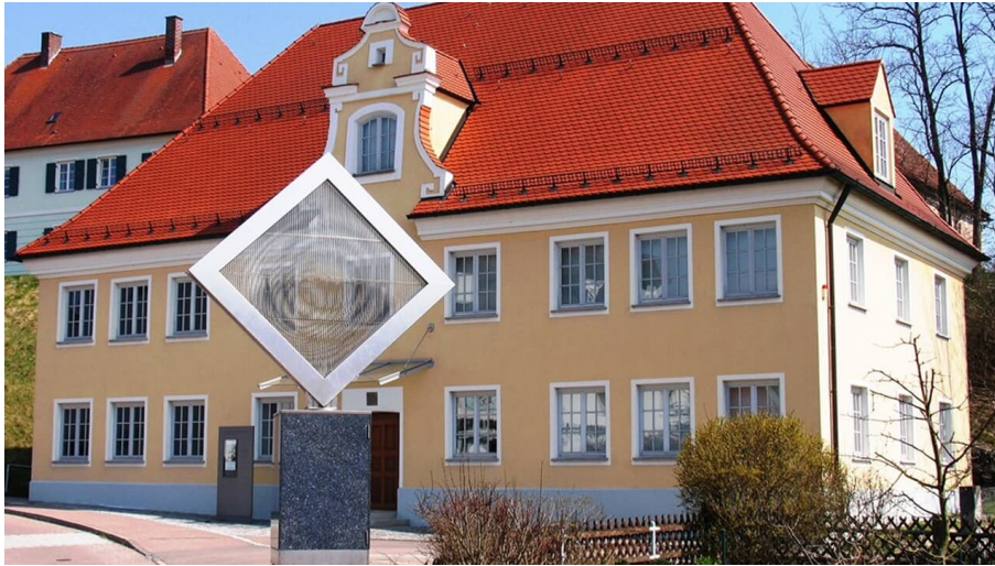
Museum für bildende Kunst im Landkreis Neu-Ulm