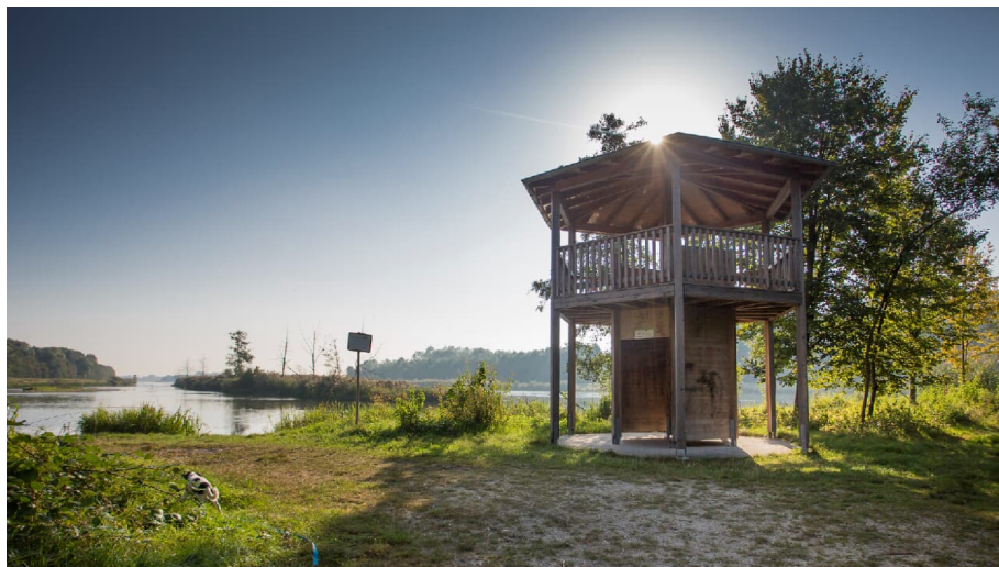
Aussichtsturm Östliche Donauauen Erlingshofen