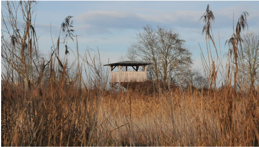
Beobachtungsturm am Biotop Polstermäher