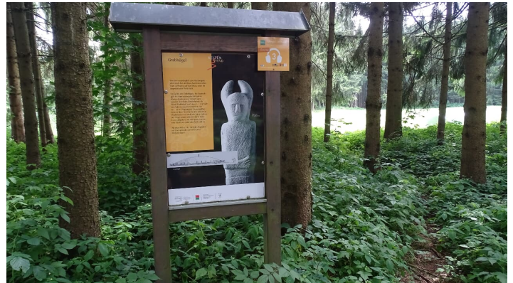
Lauschpunkt am Grabhügel