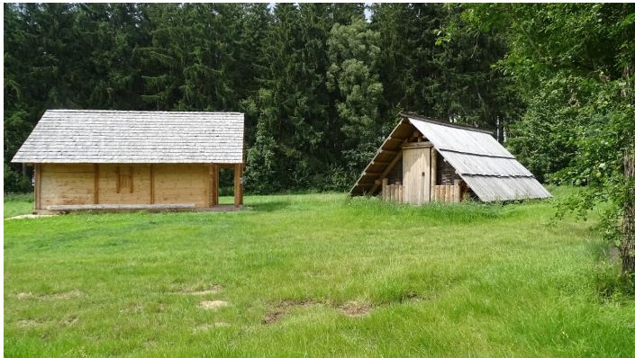
Lauschtour Keltenpfad - © Regionalmarketing Günzburg GbR

i-Pod Verleihstation: Bayerisches Schulmuseum Ichenhausen, Schlossplatz 3-5, 89335 Ichenhausen, Tel. 08223/6189