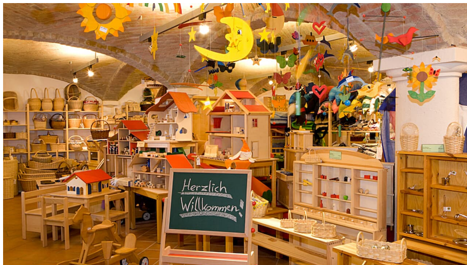
Ursberger Laden