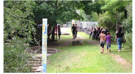
Nebelbachpark 2