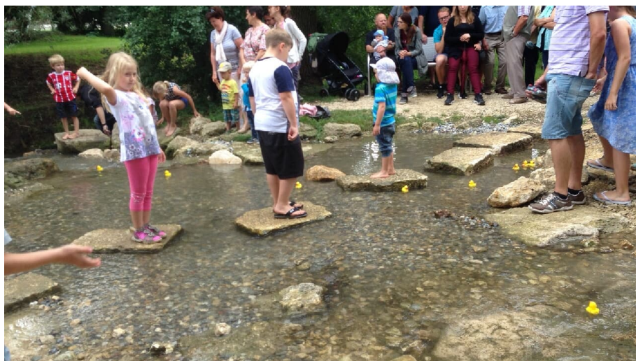
Nebelbachpark 1