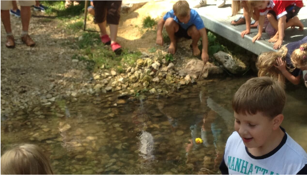
Nebelbachpark 3