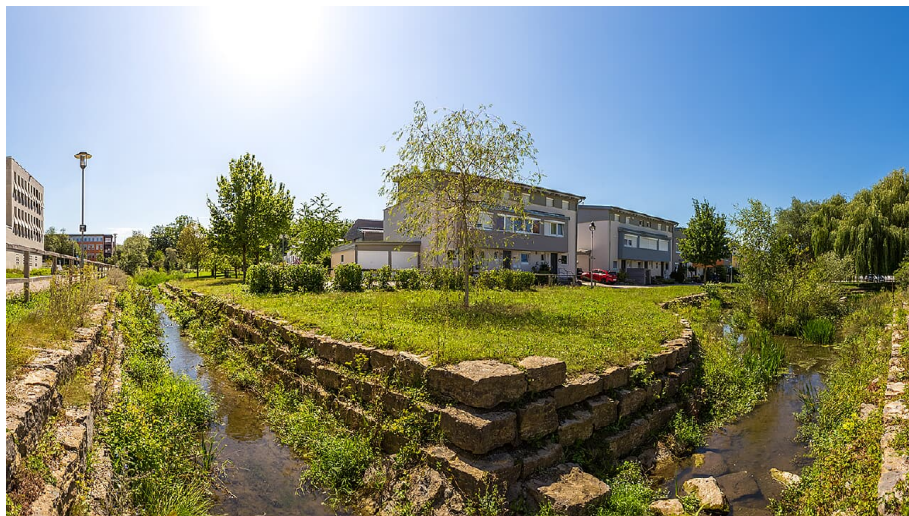
Gewässerpark Günzaue

Wo früher die Textilindustrie sich die Wasserkraft zu nutze machte, lädt heute mitten in der Stadt der Gewässerpark Günzaue zum Spaziergang entlang des ehemaligen Werkkanals der Günz ein.