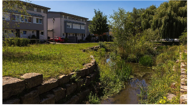
Gewässerpark Günzaue