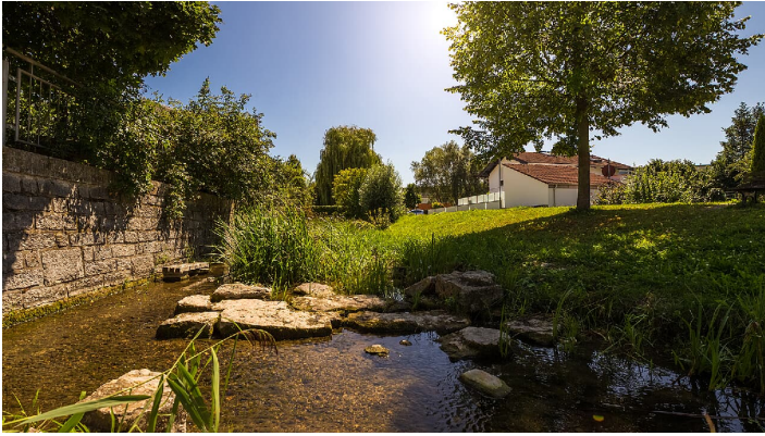
Gewässerpark Günzaue - © Foto: Philipp Röger für die Stadt Günzburg