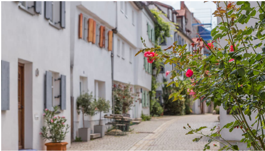
Frauengasse Günzburg