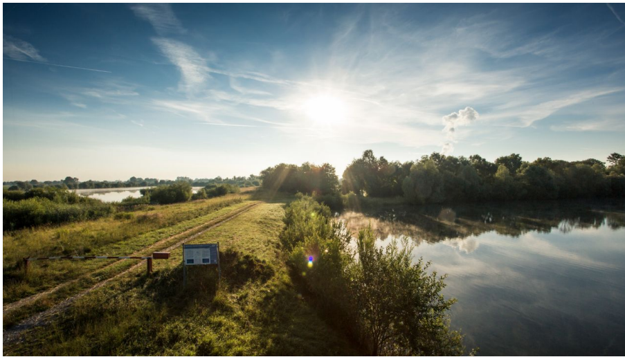
Fetzersee im Gundelfinger Moos