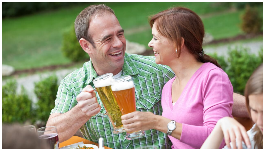
Einkehr im Biergarten