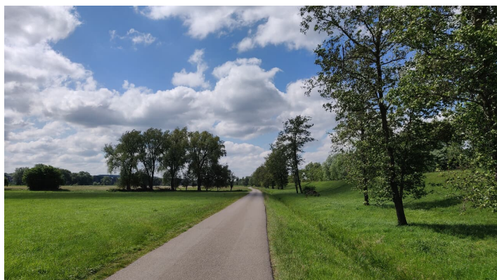
Weg entlang Oberegger Stausee