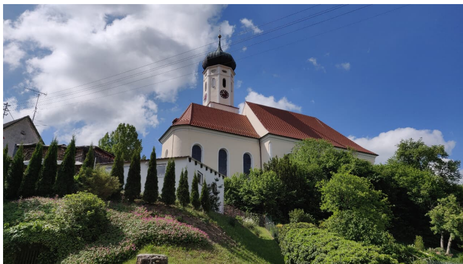
St. bBasius Oberwiesenbach