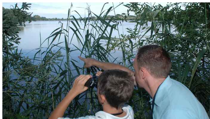
Tierbeobachtung Oberegger Stausee