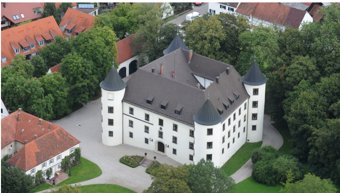
Schloss Jettingen