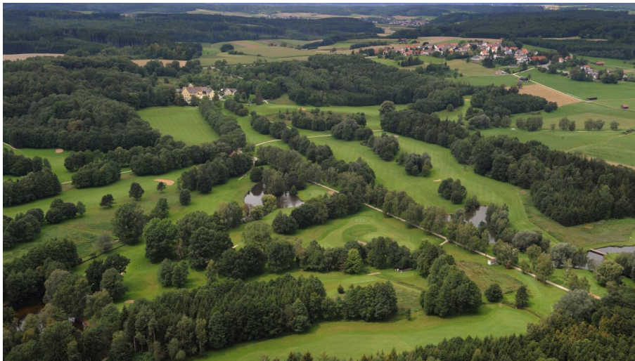
Landschaft bei Golf-Club Schloss Klingenburg