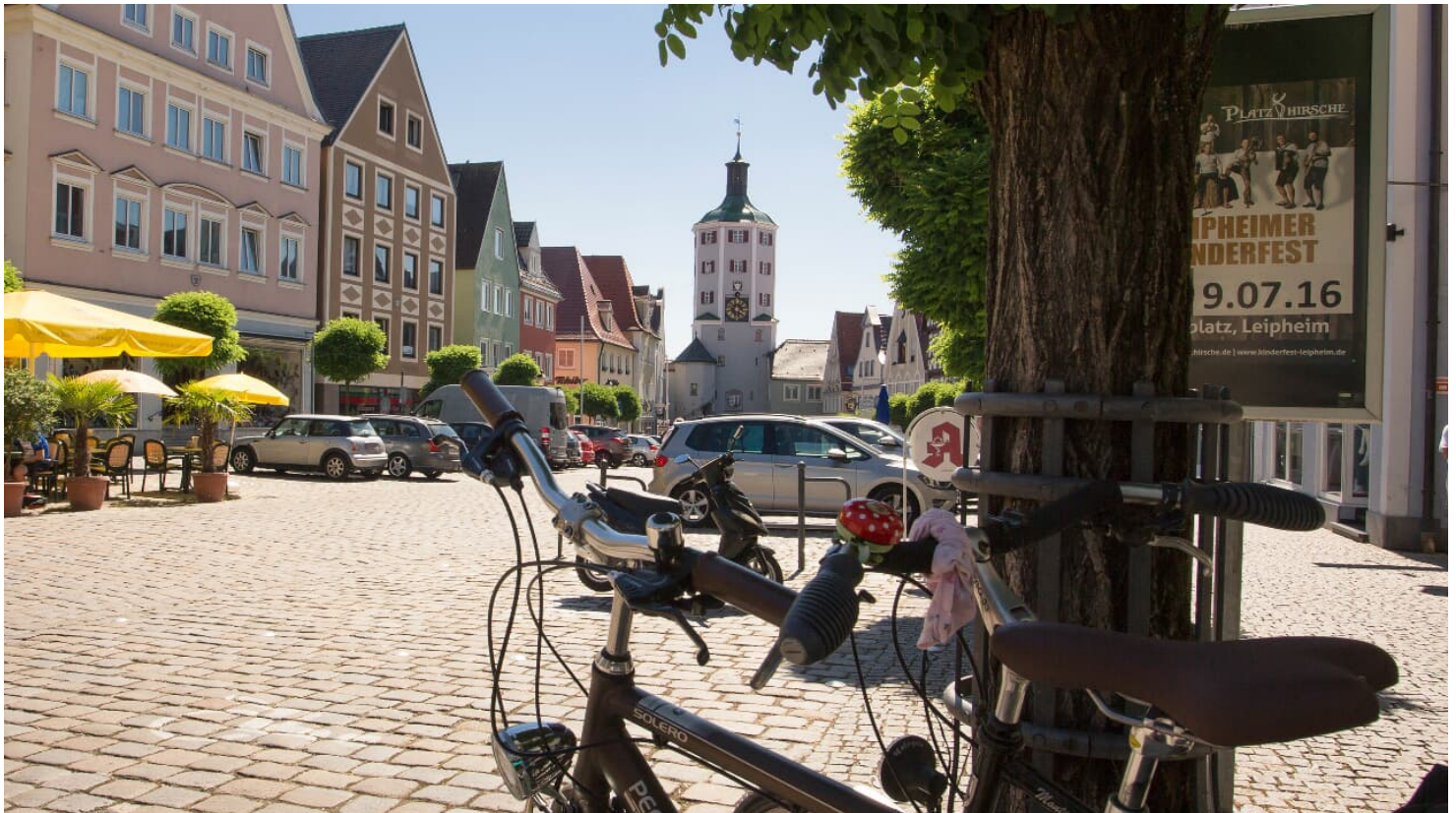
Marktplatz in Günzburg