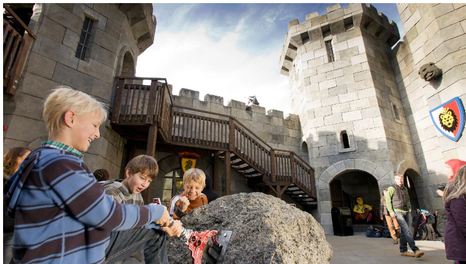
LEGOLAND Deutschland