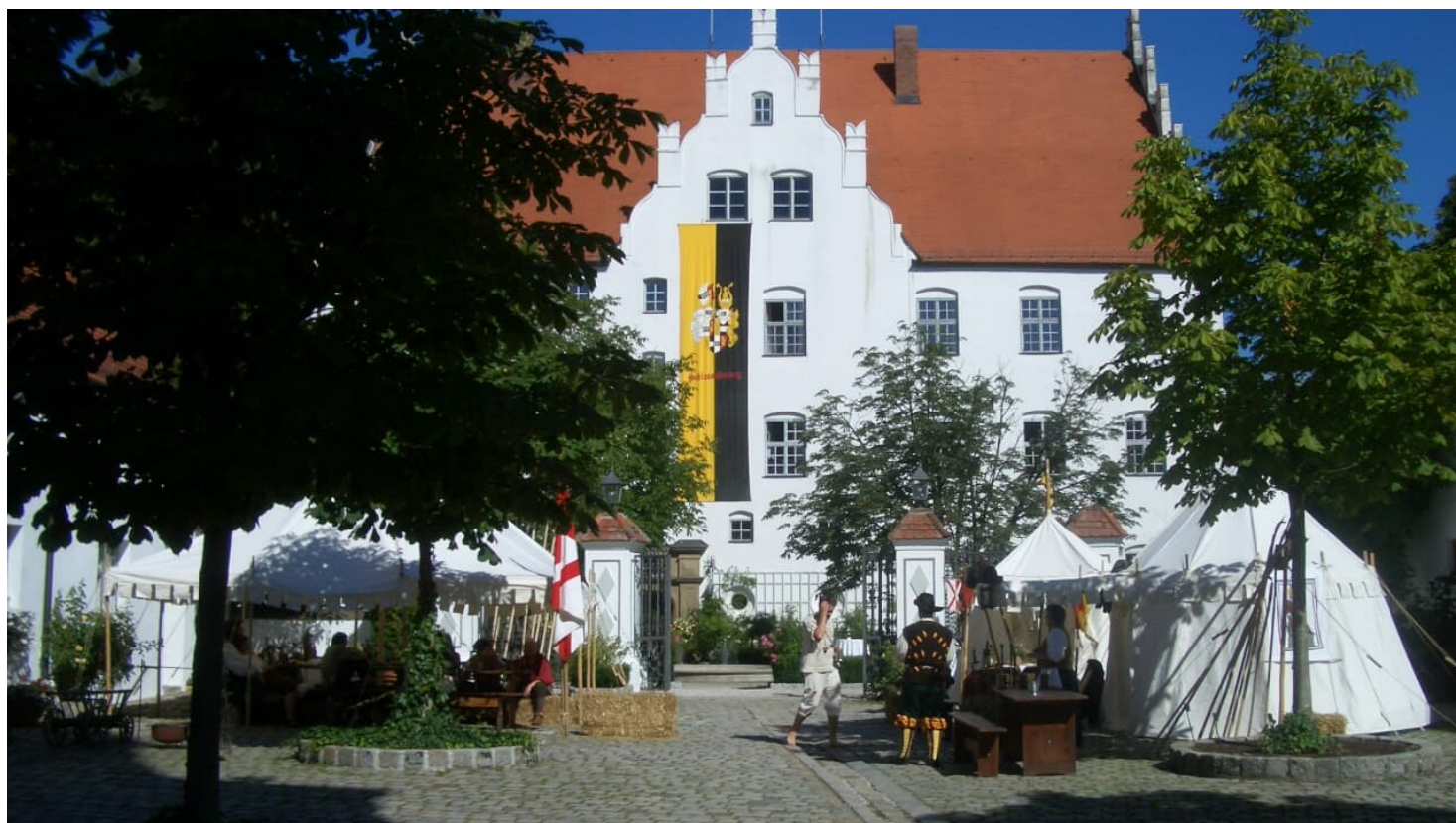
Schloss Neuburg a. d. Kammel