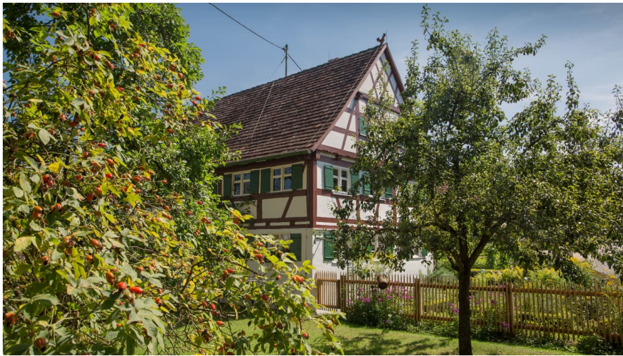
Kreisheimatstube Stoffenried