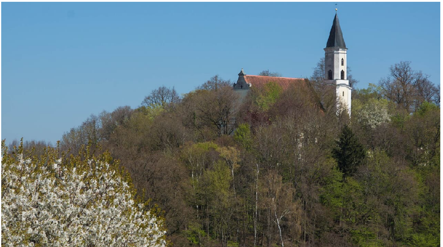
Wallfahrtskirche Allerheiligen