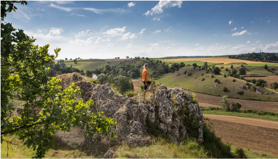
Wildfang - © Fouad Vollmer