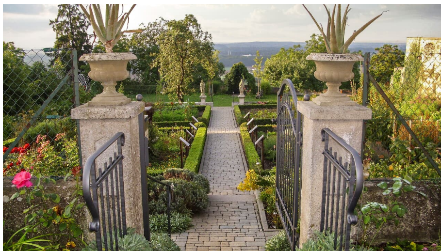
Klostergarten Oberelchingen