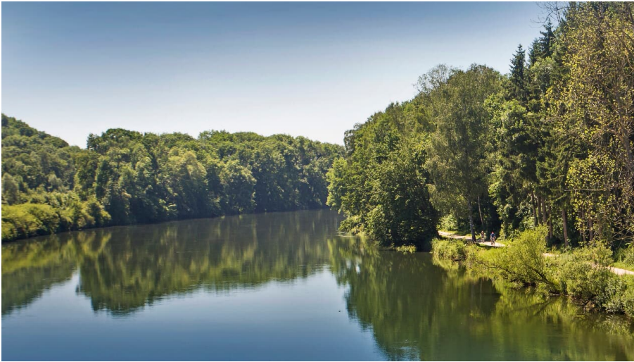
Donau bei Günzburg