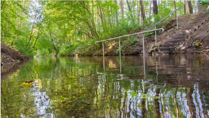
Naturkneippanlage in der Donau bei Dillingen