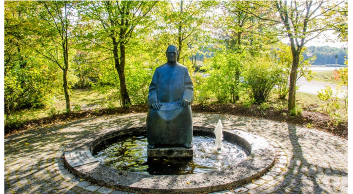
Sebastian Kneipp Denkmal - © Jan Koenen