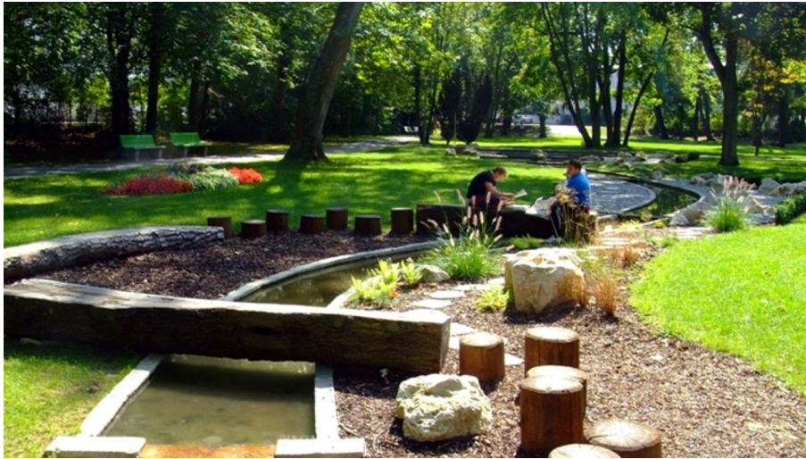
Kneipp-Wasser-Wohlfühlpfad im Dillinger Taxispark