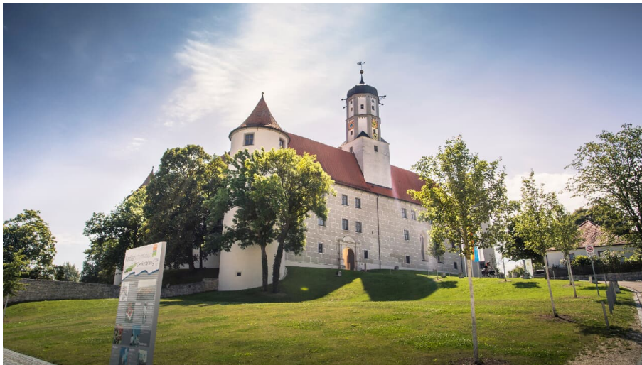
Schloss Höchstädt