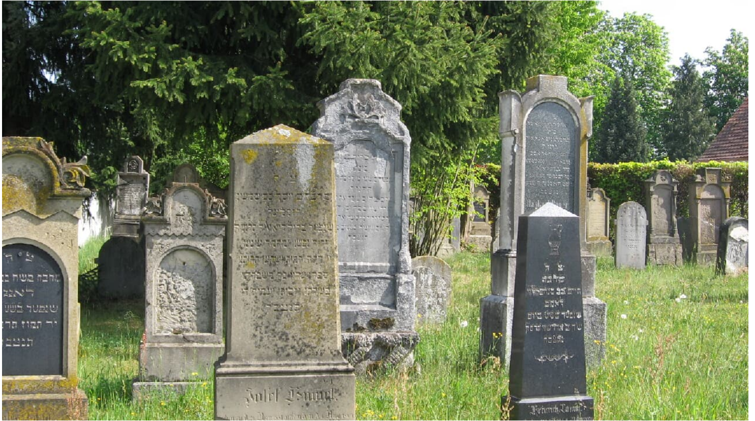
Jüdischer Friedhof Buttenwiesen