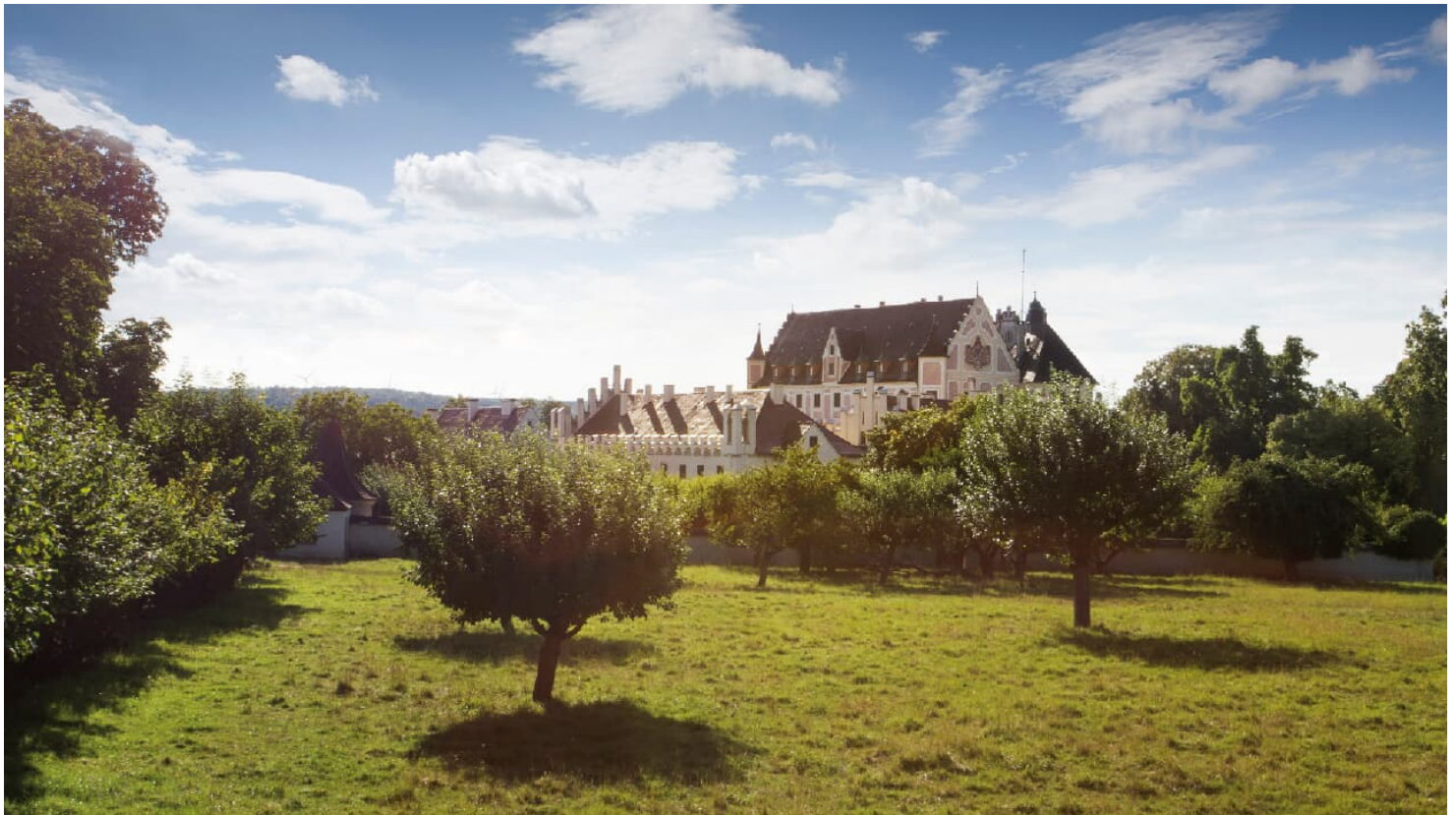
Dischingen Schloss Taxis