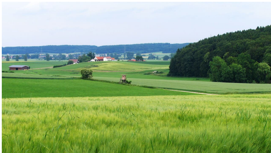
Mariensteig-Tour zwischen Kellmünz und Altstadt