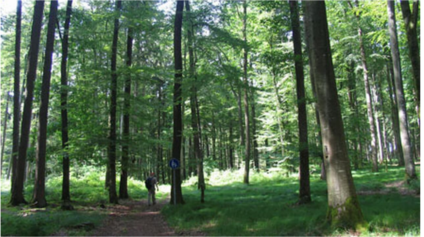
Mariensteig-Tour zwischen Kellmünz und Altenstadt