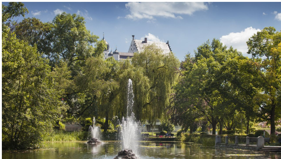
Illertissen Stadtpark